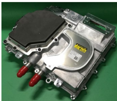
搭載リアインバーター