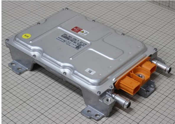
搭載DCDCコンバータ外観