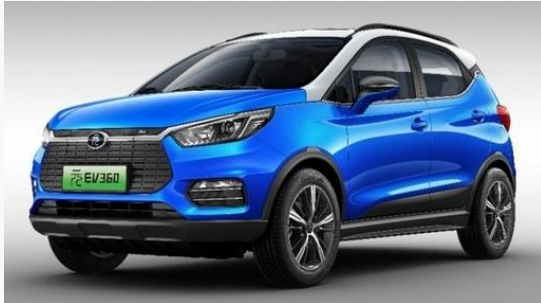
BYD 元 EV360 Webより抜粋