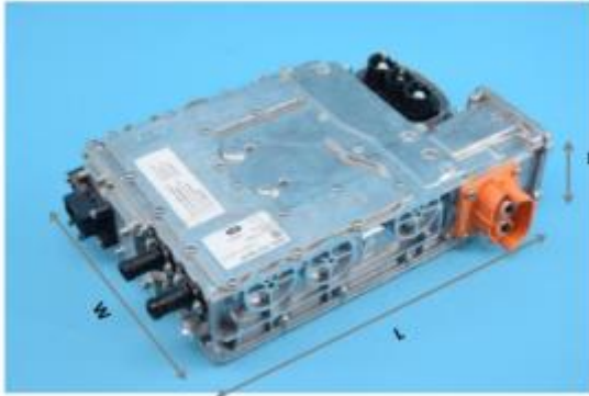
搭載インバーターユニット