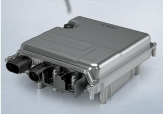
モジュール外形写真