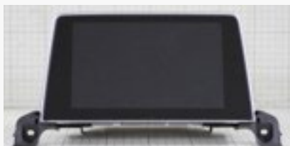
プジョー3008 ディスプレイ部