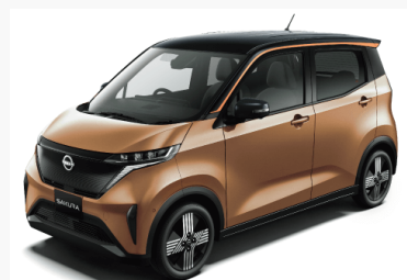
日産サクラ