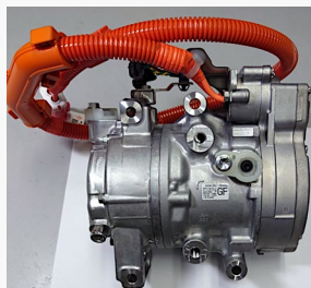
搭載コンプレッサ