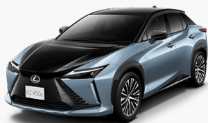
TOYOTA LEXUS RZ450e

引用: https://lexus.jp/models/rz/features/price_grade/